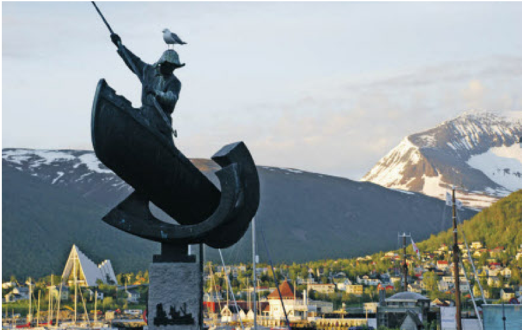
Tromsø, das Tor zum Eismeer, präsentiert sich auch noch um ein Uhr nachts im Glanz der Mitternachtssonne.

TRIEST: Ein bisschen Wien an der Adria. Seite XIII AUSTRIAN: Check-in per SMS. Seite XII