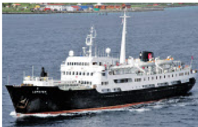
Alt, aber nicht gebrechlich: die MS Lofoten.