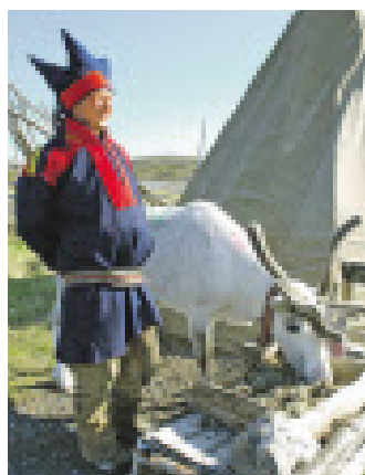
Same mit weißem Ren.

Der Bus hält knirschend vor dem Besucherzentrum,