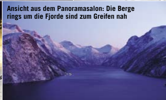
Ansicht aus dem Panoramasalon: Die Bergrings um die Fjorde sind zum Greifen nah