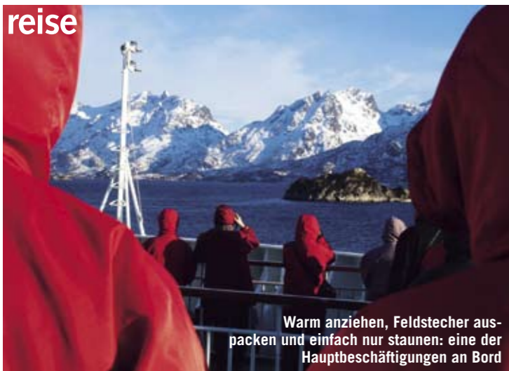
Warm anziehen, Feldstecher auspacken und einfach nur staunen: eine der Hauptbeschäftigungen an Bord