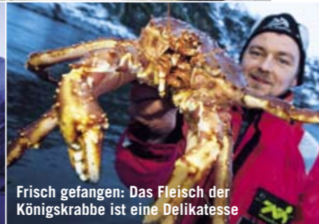
Frisch gefangen: Das Fleisch der Königskrabbe ist eine Delikatesse