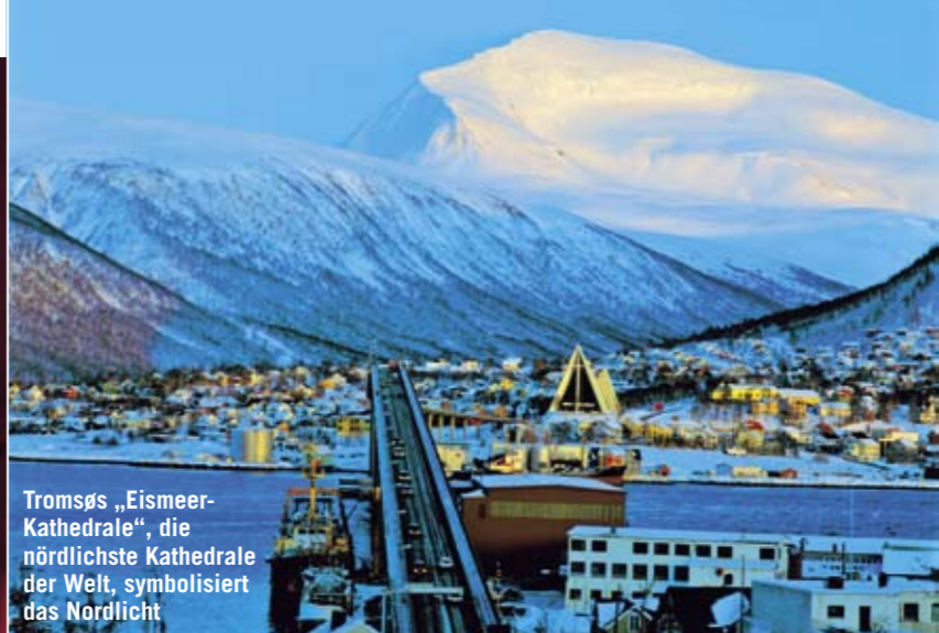
Tromsø „Eismeer-Kathedrale“, die nördlichste Kathedrale der Welt, symbolisiert das Nordlicht