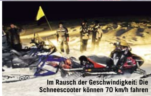
Im Rausch der Geschwindigkeit: Die Schneescooter können 70 km/h fahren