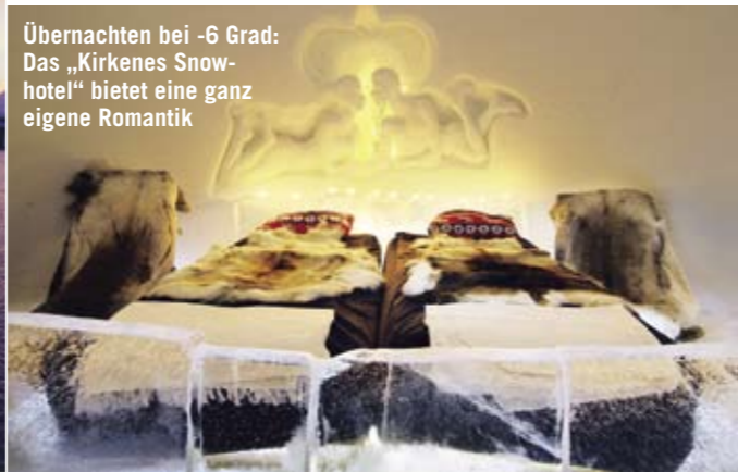
Übernachten bei -6 Grad: Das „Kirkenes Snowhotel“ bietet eine ganz eigene Romantik