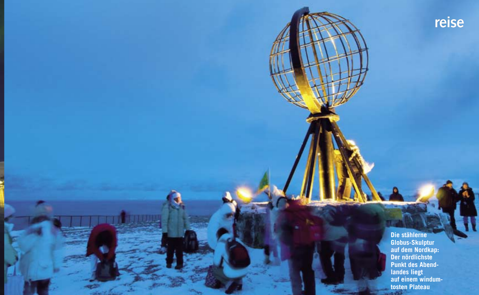
Die stählerne Globus-Skulptur auf dem Nordkap: Der nördlichste Punkt des Abend- landes liegt auf einem windum- tosten Plateau

Abendstimmung über Tromsø, der nördlichsten Metropole Norwegens: Jetzt beginnt hier das studentische Nachtleben