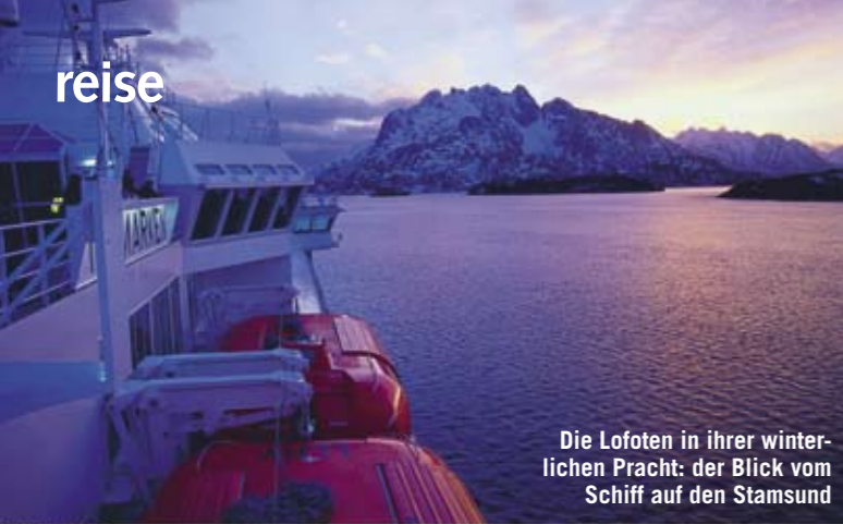
Die Lofoten in ihrer winterlichen Pracht: der Blick vom Schiff auf den Stamsund