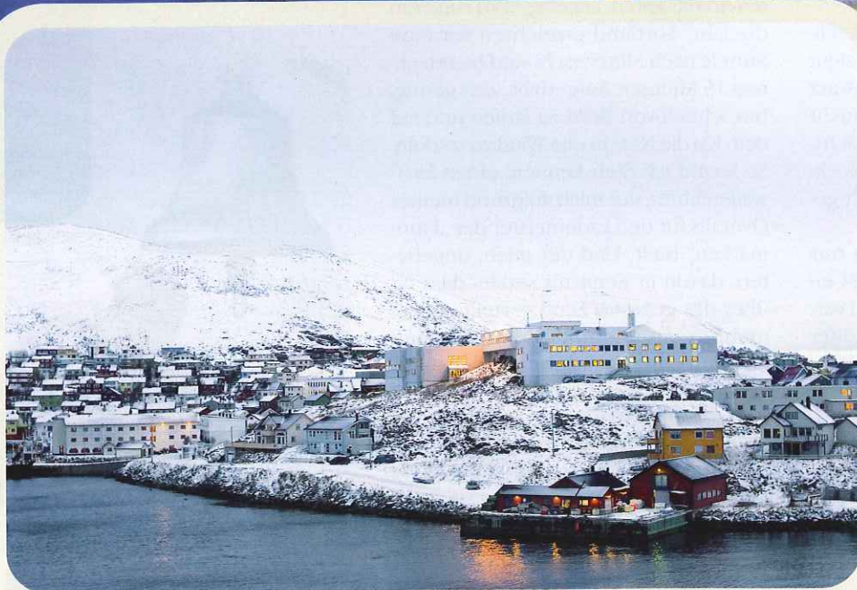
Unterwegs mit der „Finmarken“: Blick auf das arktische Kulturzentrum (o.) von Hammerfest und auf die Stadt Honningsvåg