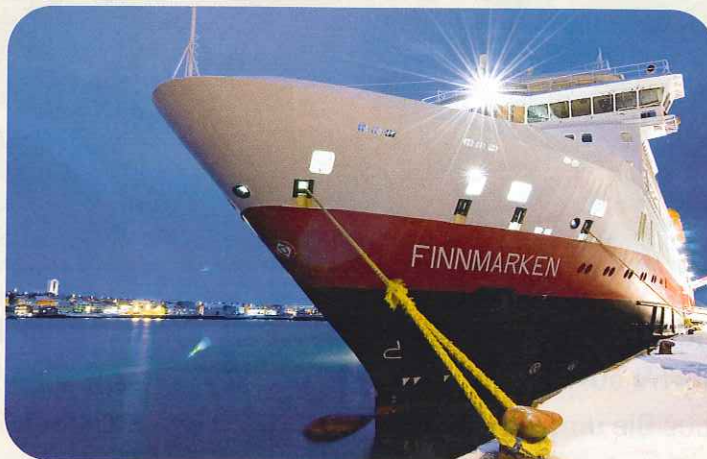
Die „Finnmarken“: Vertäut im Hafen von Vasdø

Mitten im Fjord springt sein Kollege Per, in dickstes Neopren verpackt, in das eisige Wasser, um aus 15 Meter Tiefe gewaltige Königskrabben heraufzuholen. Ganz mutige Gäste zwingen sich selbst in knallrote, wasserdichte Überlebensanzüge und lassen sich von >