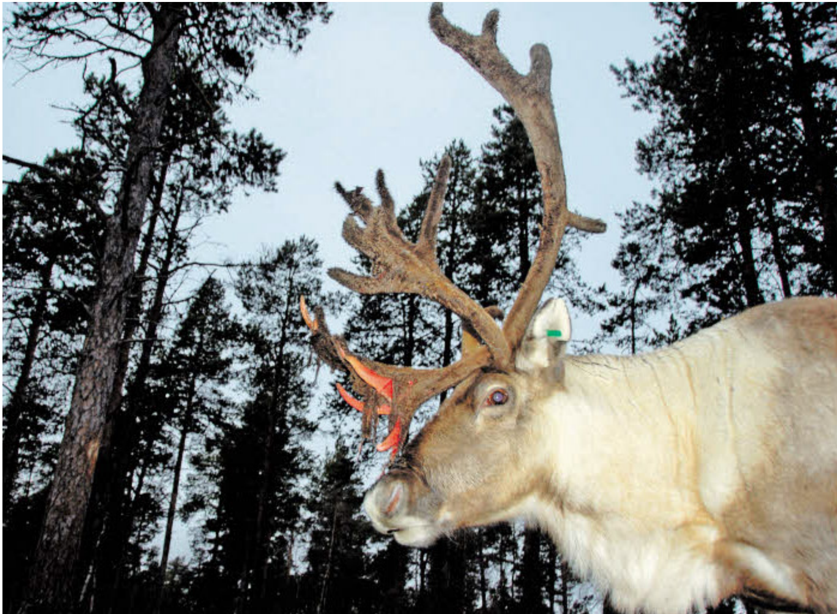
Rentiere prägen das Bild in den Wäldern Lapplands. In den Wintermonaten muss der Bestand stark reduziert werden, damit die Herden genug Nahrung finden.

MALLORCA: Trekking auf einsamen Pfaden Seite XV